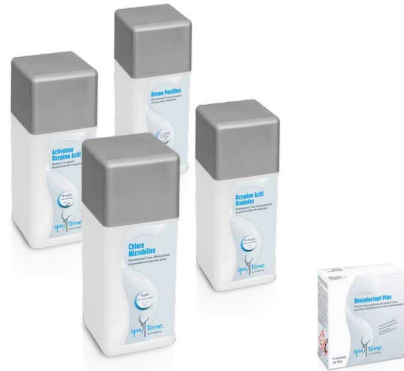
Pratique : dosage facile grâce aux sachets prédosés « Désinfectant plus »

Afin que chaque goutte d'eau de votre spa soit d'une qualité irréprochable, SpaTime vous garantit une désinfection efficace selon 3 principales méthodes : le chlore, le brome ou l'oxygène actif.